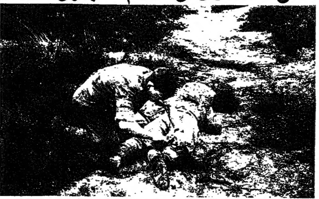
حياة الانسان هي المستهدفة اولا واخيرا

ينتظر ان يتجاوز الاتفاق العسكري في العالم هذا العام ، ما يعادل خمسمائة الف مليون دولار . اي زيادة لا تقل عن عشرة في المئة من مجموع النفقات المقررة عن العام الماضي وهو ٦٠٠ الف مليون دولار . كما يتوقع ان يصل مستوى الاتفاق على مستقرات الدفاع في العالم الى ٦٠٠ الف مليون دولار خلال